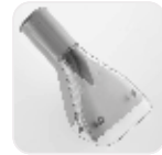
Küçük Yıkama Aparatı