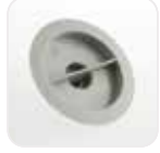
Kartuş Filtre Kapağı