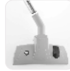
Sert Yüzey ve Halı Temizleme Aparatı