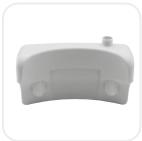
Temiz Su Tankı