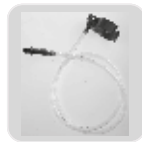
Yıkama Hortum Grubu