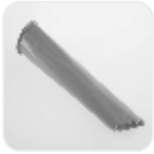
Kenar Köşe Temizleme Aparatı