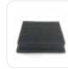
Hava Çıkış Filtresi