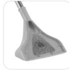
Büyük Yıkama Aparatı