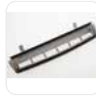
Sert Yüzey Yıkama Lastiği